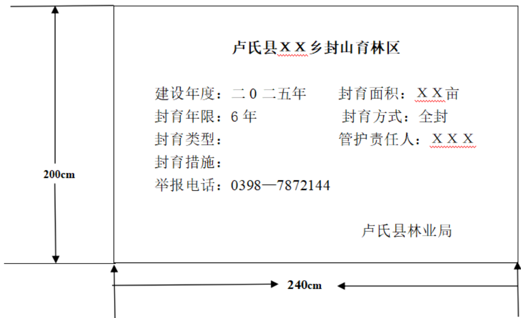
封山育林年度建设大标牌（正面示意图）

封山育林标志牌（小）： 为达到醒目的封育区标志，使人畜远离封山育林区域，特在封育区增加小标志牌，进入区域境内的人们能看到封山育林标志，增强护林爱林自觉性。封山育林标志牌（小）规格为 100cm x 67cm 的长方形，牌面靠两腿支撑固定，两腿材料为镀锌方管，规格为 3cm x 3cm，镀锌方管总长 147cm，其中地埋 30cm，地面至牌面下沿 50cm，牌面下沿至牌面上沿 67cm，牌面正面书写封山育林四至边界及举报电话等内容。牌背面喷字封山育林制度。小标牌共设置 81 个。