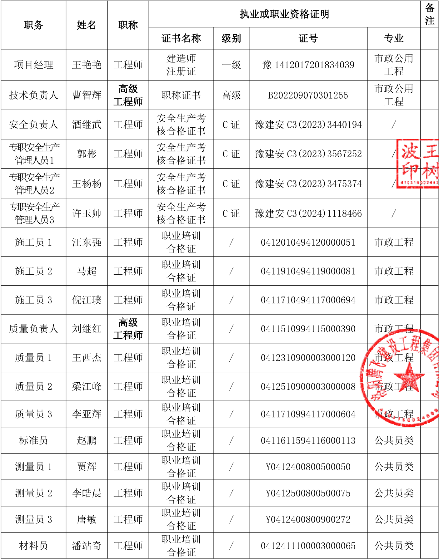
(一) 项目管理机构组成表